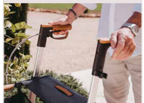
Umbaubar auf Einhand-Simultanbremse