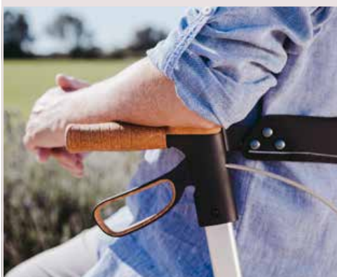
Armauflage aus Kork-TPE

Anti-Rutsch-Pads erleichtern das Ankippen des Rollators